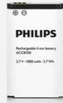
Li-Ion-Akku (1000 mAh)